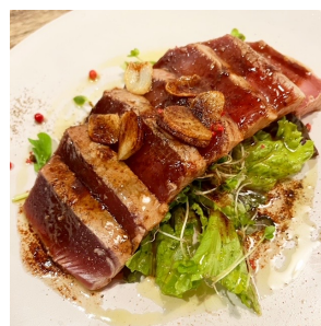
炙りマグロの焦がしバター醤油 ¥800 ハーフ ¥450