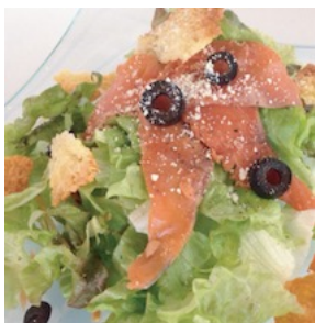
maltid サラダ .....¥850 自家製スモークサーモンとカリカリチーズのサラダ。