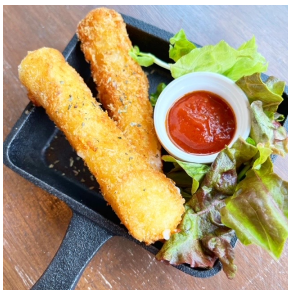
モッツアレラチーズスティック・・・¥650