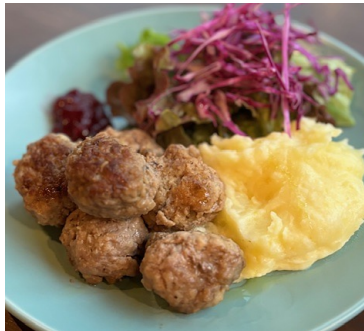
スウェーデン風ミートボール（ミニサラダ付） ・・・¥880

スウェーデンでもっともポピュラーな家庭料理。 クリーミーなミートボールに、ベリー系のジャムをつけてお召し上がりください。