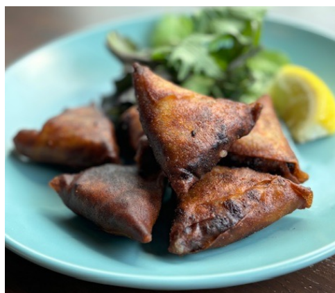
モロッコの揚げ春巻 ブリワット 3ヶ¥400 6ヶ ¥750