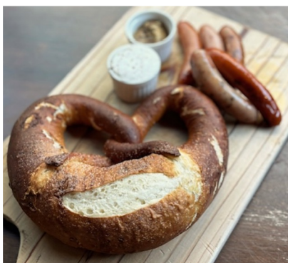
特大プレッツェルとアンチョビディップ &ウインナー 5種盛り ・・・¥1,650