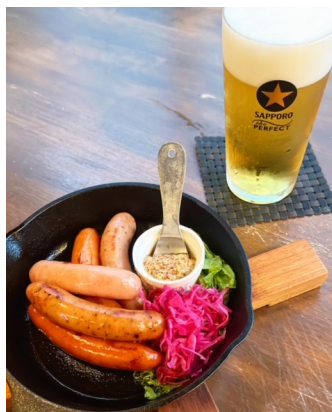
Pølseplaten ... ¥ 680