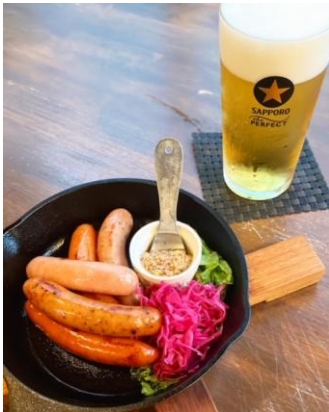
소시지 접시 ... ₩ 680