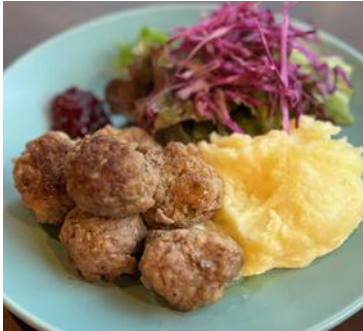
스웨덴식 미트볼와 월굴잼