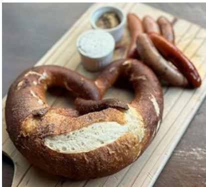
큰 프레첼 & 멸치 크림 치즈 딥 & 구운 소시지 5개